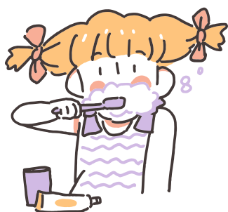
ESCOVANDO OS DENTES