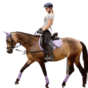
ANDANDO A CAVALO