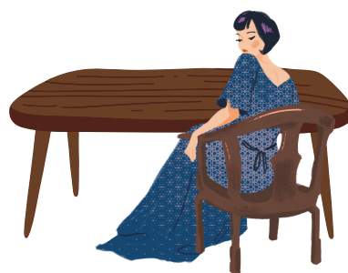
SENTADA À MESA