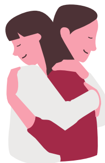
ABRAÇANDO A AMIGA