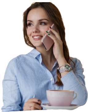
FALANDO AO TELEFONE