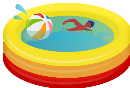
NADANDO NA PISCINA