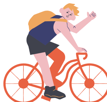
ANDANDO DE BICICLETA