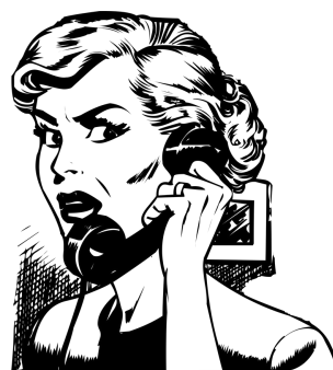
FALANDO AO TELEFONE