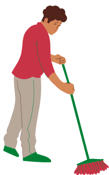
VARRENDO O CHÃO